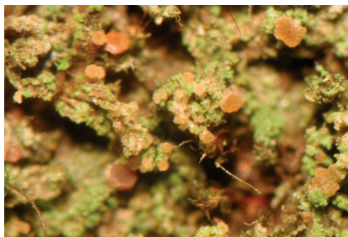
Abb. 3: Veздаea leprosa