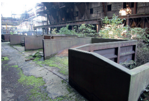
Abb. 2: Typischer Lebensraum der Veздаea - auf Eisen am Arten. Standort wie in Abb 2.