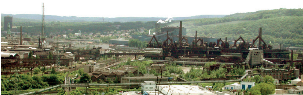
Abb. 1: Blick auf das Gelände der Völklinger Hütte mit der ehemaligen Kokerei und den Hochöfen rechts im Bild.

Die Bedeutung alter Kupferschiefer-Halden hat HUNECK (2006) eindrucksvoll beschrieben. Berichte über Erst- und Wiederbesiedlung von Industrieanlagen durch Flechten sind noch spärlich (FEIGE & KRICKE 2001, 2002, JOHN 2006b). Es häufen sich jedoch in letzter Zeit die Hinweise auf die Besiedlung künstlicher anthropogener Substrate durch Flechten, wie Plastik STOLLEY 2000), Gummi (JOHN 2006c) und vor allem Eisengegenstände (JOHN 1979, 2010).