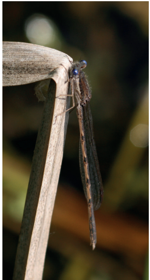
Abb. 2a, b: Die Gemeine Winterlibelle ( Sympecma fusca ); b: geschlechtsreife Imago (mit blauen Augen). Die Tiere sitzen meist hervorragend getarnt an trockenen Halmen oder dünnen Zweigen.