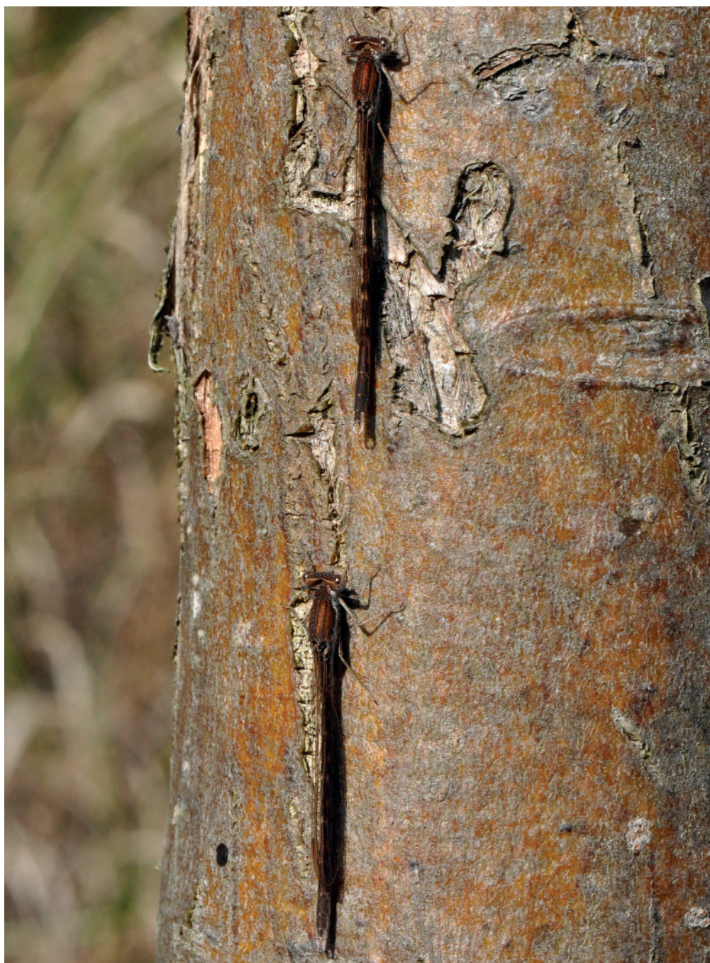
Abb. 3a, b: Winterlibellen im Herbst-Lebensraum an einem Baumstamm (Trockenhang bei Hemmersdorf, 10.10.2012); b: mit Beute (nächste Seite).