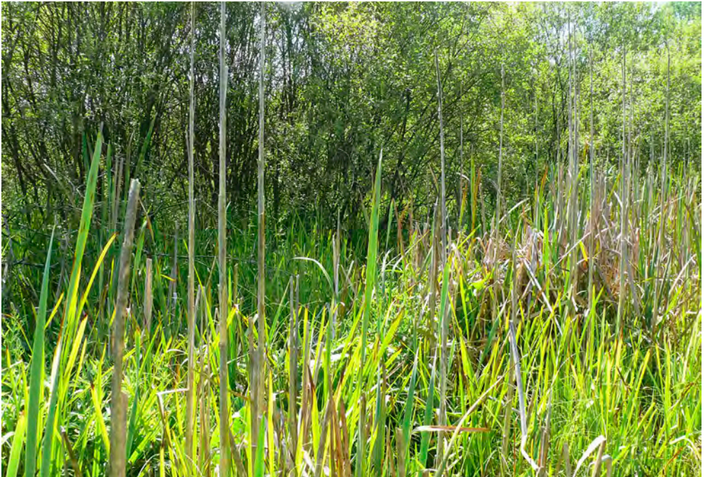
Abb. 2c: Männchen-Aufenthaltsbereiche im Halbschatten und randlich von kleinen Gehölzen an einem besonders heißen Tag (21.07.2013).