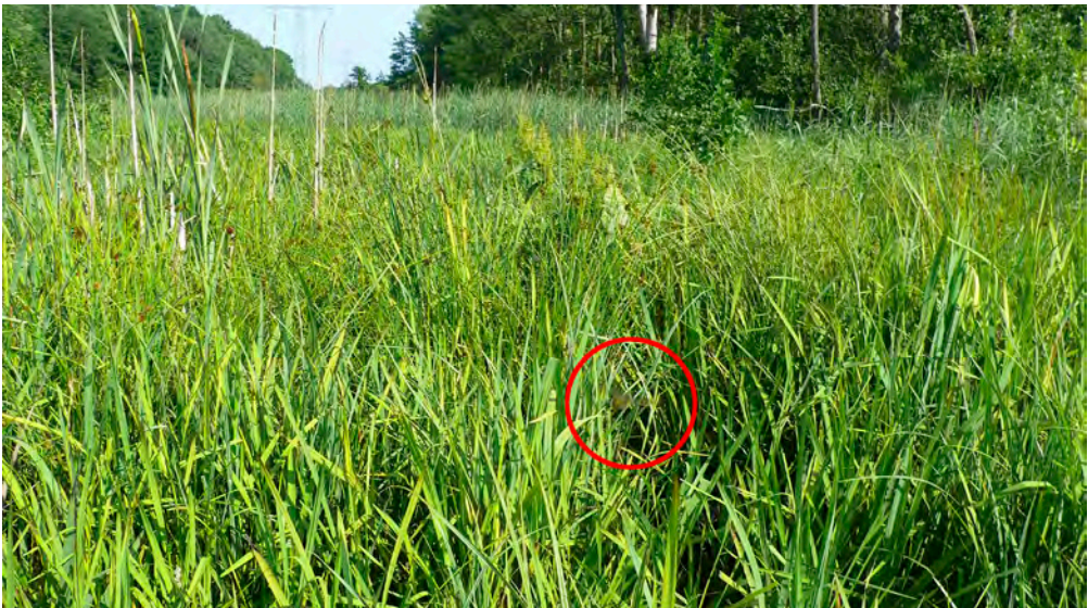
Abb. 2e: Mikrohabitat = Flugbereich eines Männchen am 07.07.2013 im Bereich einer Vernässungsstelle.