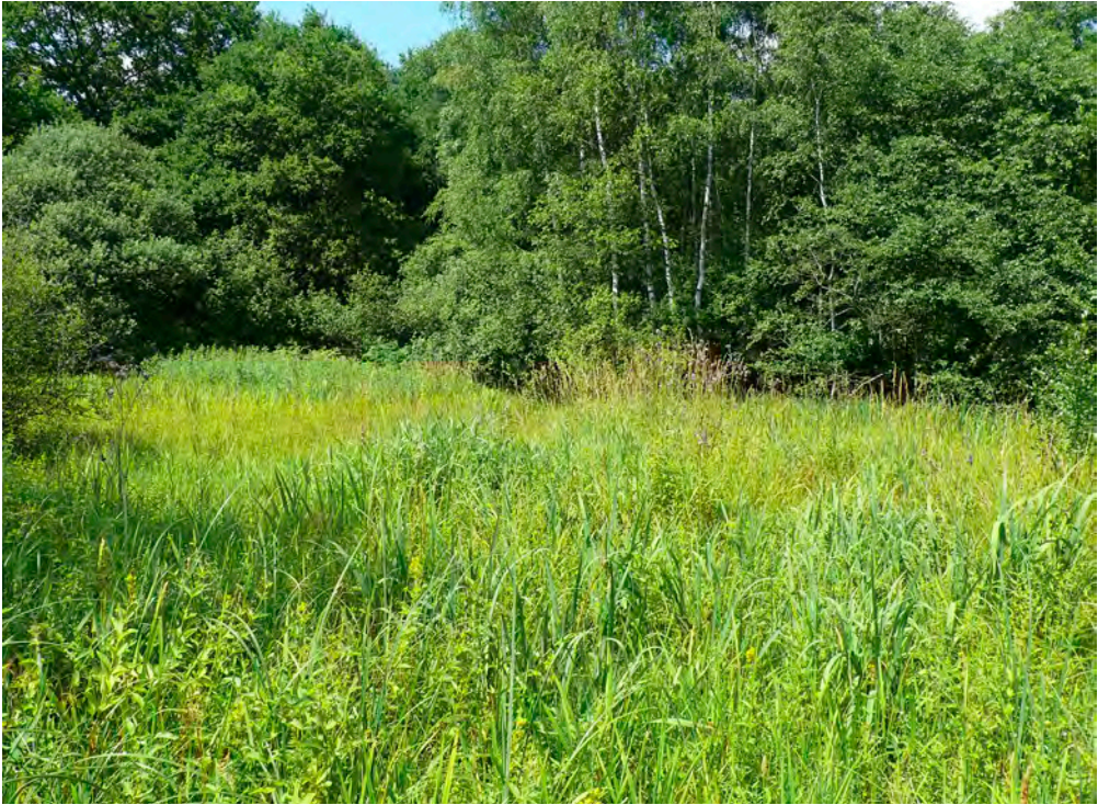
Abb. 2d: Blick in den westlichen Teil des Zwischenmoorbereiches; neben Gräben, Niedermoorschlenken und Vernässungsstellen im Bereich von Röhrichten und Großseggenrieden auch ein potentieller Larvalebensraum (21.07.2013).