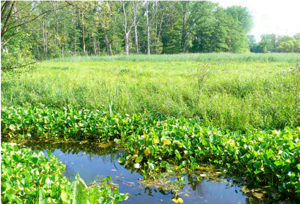
Abb. 2: Somatochlora flavomaculata in der Bistau – Habitate im Juli 2013.

a: Habitataspekt der Bistau in einem der Schwerpunktbereiche mit Gräben, Niedermoor, Großseggenrieden und Röhrichten.