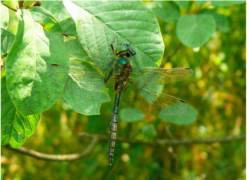
Abb. 2f: Gefleckte Smaraglibelle – Männchen, 21.07.2013.