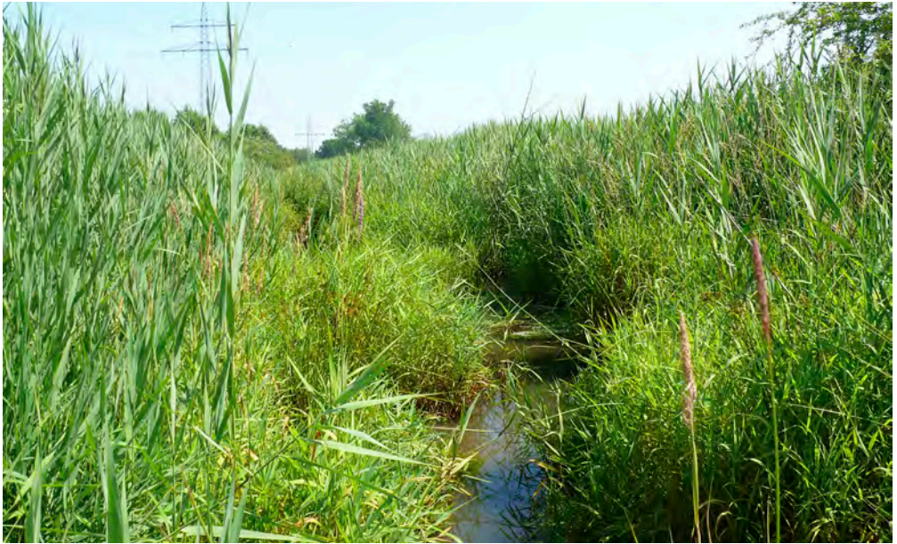
Abb. 2b: Männchen-Aufenthaltsbereich im Umfeld des Grabens im mittleren Teil des FFH-Gebietes (14.07.2013).