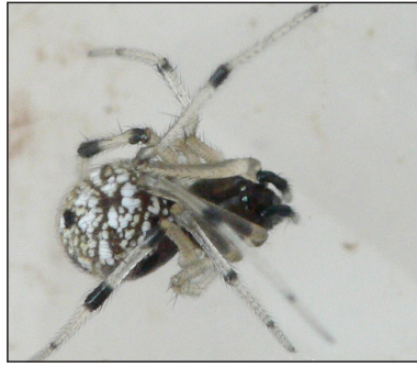
Abb. 14: Männchen und Weibchen der Kugelspinne Neottiura suave- olens , Jézainville, 15.06.2006.