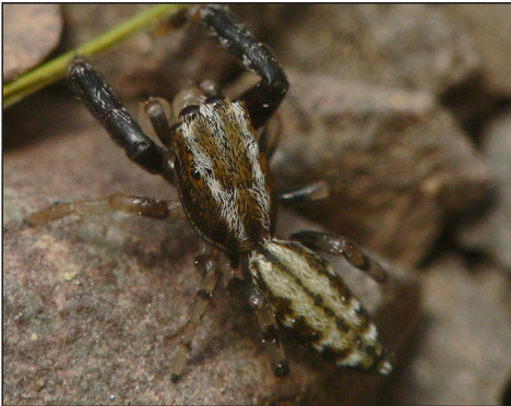
Abb. 12: Junges Männchen der Springspinne Marpissa nivoyi , Fontenoy-sur-Moselle, 17.06.2006.