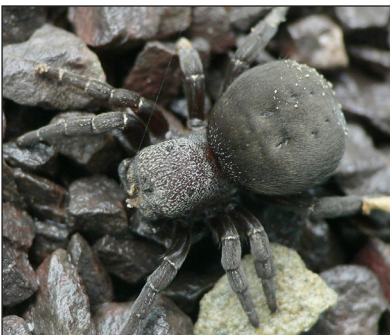
Abb. 5: Weibchen der unterirdisch lebenden Röhrenspinne Eresus kollari , Fontenoy-sur-Moselle, 17.06.2006 (ausgegraben und auf künstl. Substrat fotografiert).