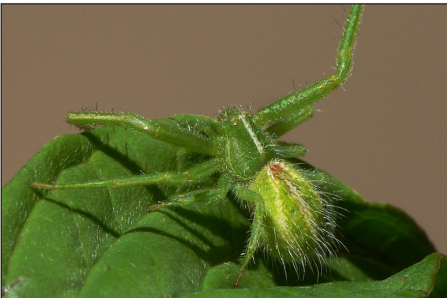
Abb. 15: Krabbenspinne Heiraeus oblongus (= H. mello-teei ), Metz, Mont St. Quentin, 28.04.2007.