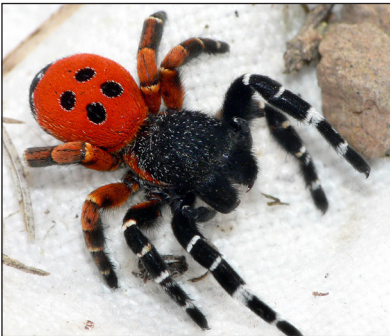
Abb. 4: Die auffällig gefärbten Männchen der Röhrenspinne Eresus kollari laufen im September auf der Suche nach Weibchen (nur etwa 2-3 Wochen lang und vor allem nachts) an der Erdoberfläche herum. Das abgebildete Tier stammt aus dem Nahe-Bergland bei Martinstein (31.08.2008).

Auf Grund ihrer speziellen Lebensweise und hohen Ansprüche an ihren Lebensraum ist bei Eresus nicht mit Neuansiedlungen weit abseits der bestehenden Kolonien zu rechnen.