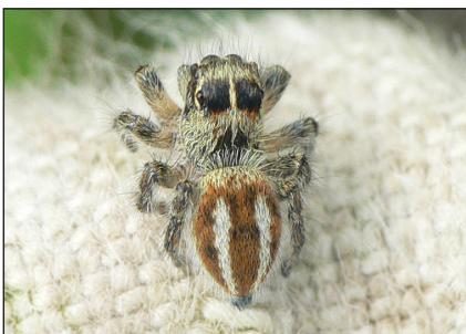
Abb. 11: Älteres Jungtier der Springspinne Philaeus chrysops , Autigny-la-Tour, 19.07.2007. Man beachte die zwei viereckigen schwarzen Flecken auf dem Vorderkörper. Hieran sind auch die Juvenilstadien der Art eindeutig zu erkennen, was für die Kartierung der Art außerordentlich hilfreich war.