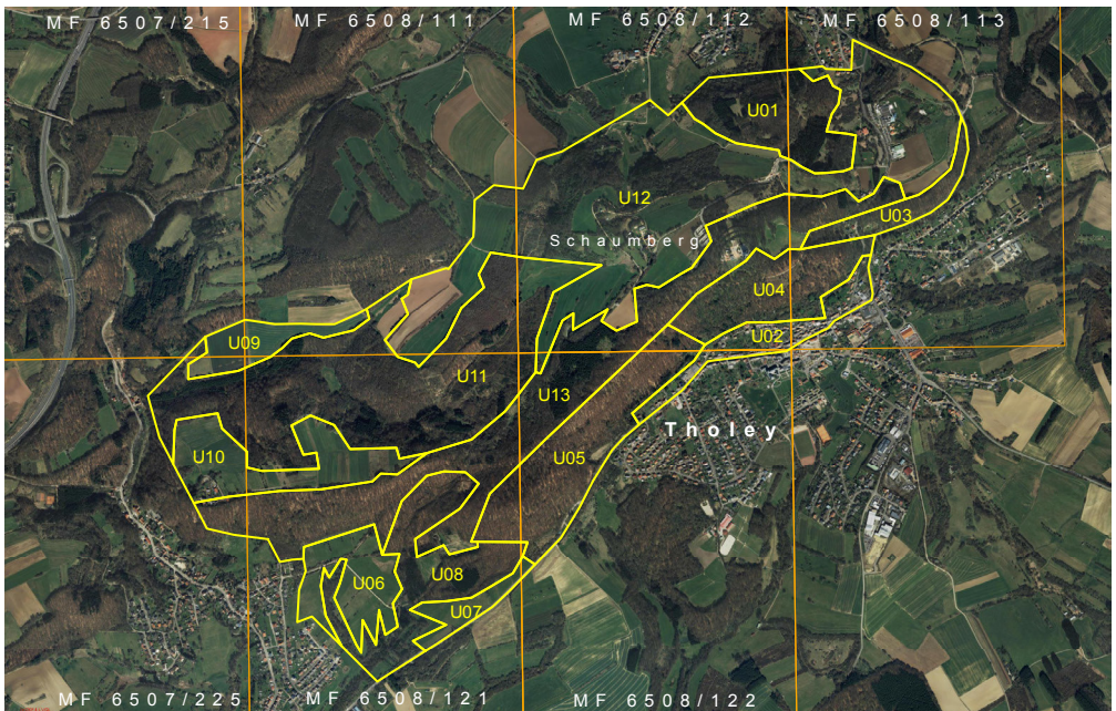
Abb. 1: Das gesamte Untersuchungsgebiet mit den Kennnummern der Kompartimente und Minutenfeldern vom Tag der Artenvielfalt 2014 am Schaumberg bei Tholey