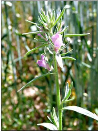
Abb. 4: Misopates orontium (Acker-Löwenmaul)

Herniaria glabra (Kahles Bruchkraut), Petrorhagia prolifera (Sprossende Felsennelke), Portulaca oleraceum (Wilder Portulak), Vulpia myuros (Mäuseschwanz-Federschwingel), Eragrostis minor (Kleines Liebesgras)