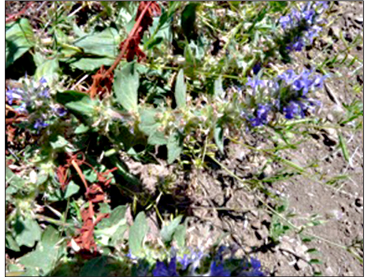
Abb. 3: Ajuga genevensis (Genfer Günsel)

Die wenigen Meldungen vom Genfer Günsel aus dem Saarland kommen überwiegend aus den Kalkgebieten von Blies-, Saar- und Moselgau; weit seltener wurde die Sippe bisher im Nordostsaarland in Bereichen mit basenreichen Vulkaniten nachgewiesen. In über 100 Jahren regionaler Pflanzenforschung gelangen kaum mehr als 20 Funde, zumeist von kleinen Beständen oder Einzelpflanzen. Standorte waren sowohl Trocken- und Halbtrockenrasen als auch Säume trockenwarmer Standorte; die Art ist Kennart der Klasse Festuco-Brometea . Im Untersuchungsgebiet wurde der Genfer Günsel auf einem lichten und felsigen Waldweg innerhalb einer Waldlichtung gefunden.