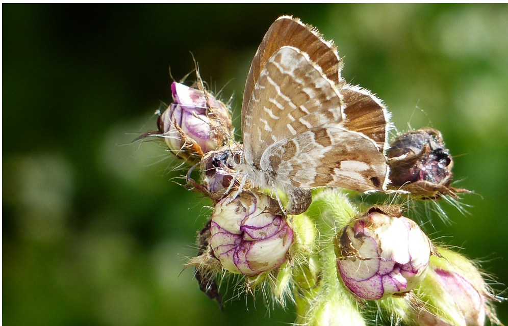
Abb. 1: Weibchen des Pelargonien-Bläulings bei der Eiablage an Geranien (2.9.2014, Theley, Johann-Adams-Mühle).