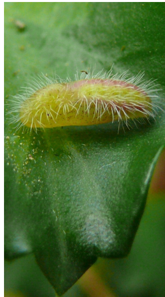
Abb. 4-6: Ei (4), Raupe (5) und Puppe (6) des Pelargonien-Bläulings (13.8.2007, Malcesine/Gardasee, Rathausplatz;)