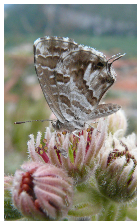
Abb. 2 a, b, c: Der Pelargonien-Bläuling ist recht klein und unscheinbar, insbesondere die braune Oberseite. Aus der Nähe betrachtet ist er jedoch mit seinem unruhigen Unterseitenmuster und seinen beiden Schwänzchen sehr hübsch (a, b: 2.9.2014, Theley, Johann-Adams-Mühle, c: 11.8.2007 Nago, Nähe Gardasee,).