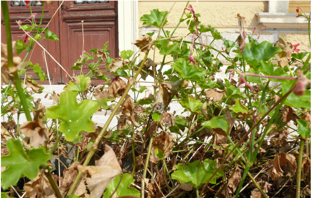
Abb. 3: Etwas ungepflegt aussehende Geranien – die könnten von Raupen des Pelargonien-Bläulings „befallen“ sein. Wer genauer hinschaut, der erkennt zwei balzende Falter und Eier. (13.8.2007, Malcesine/Gardasee, Rathausplatz;).