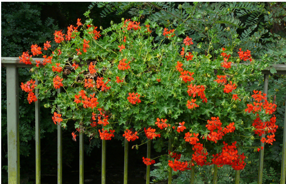
Abb. 7: Klassisch: Geranien an einem Geländer – potenzielles Habitat für den Pelargonien-Bläuling (2.9.2007).